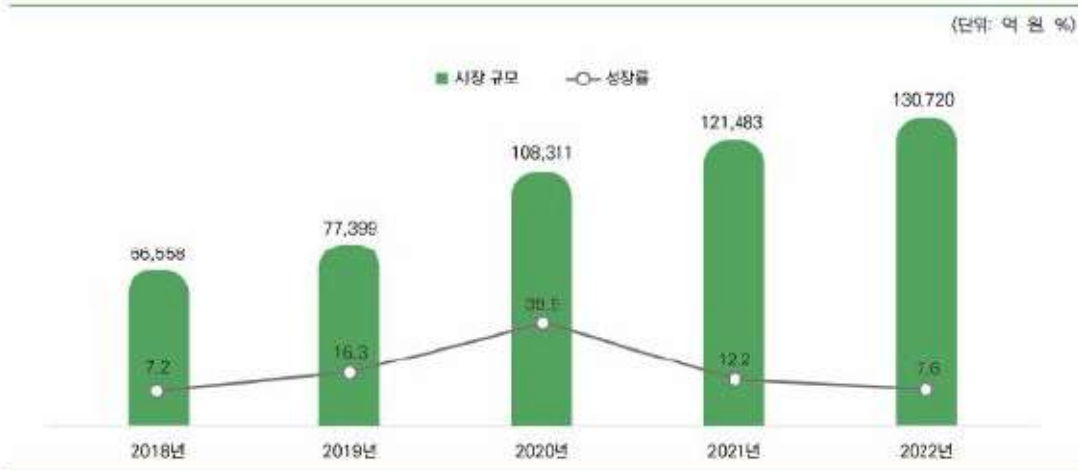
국내 모바일 게임시장 규모(2018~2022년)