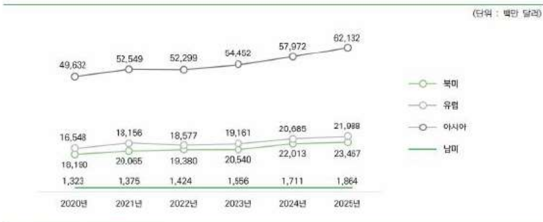
세계 권역별 모바일 게임 시장규모 및 전망(2020~2025년)

성에 대한 기대는 여전하지만, 2022년의 조정과 코로나19란 특수한 외부 환경변화가 아니라고 한다면, 예전과 같은 고성장이 없을 수 있다는 우려를 하게 됩니다.